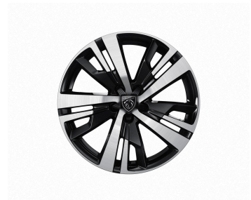
18" Diamond Cut Alloy Wheels